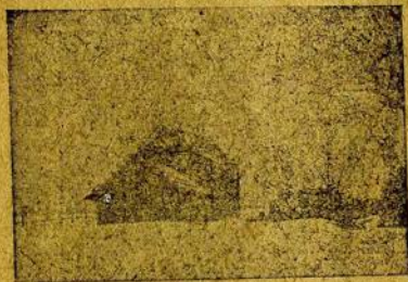
Дер. Горки место заседаний комитета.