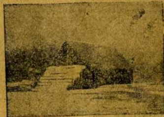
Яринская рига Место собраний

«С пением марсельезы рабочие направляются вдоль Тезина к Бонячкам, где на фабрике собрались для выборов. Над толпой реет красное знамя, на нем