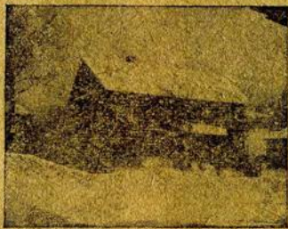
Явочная квартира дер. Антропиха Голубевой

Партийная организация стала во главе движения. 14 февраля 1907 года на заседании Исполнительного бюро был обсужден вопрос о борьбе с хлебной спекуляцией и о наказе вновь избранному депутату во II Госуд. Думу. На заседании выявились две точки зрения. Одна предлагала провести по всем фабрикам и заводам собрания, на которых выбрать представителей от всех рабочих в город, провести митинг и выбрать совет рабочих депутатов. Совет и должен регулировать все вопросы. Эта точка зрения взяла верх. Прежде чем практически провести решение в жизнь, большевистская группа провела собрание в клубе с представителями всех фабрик.