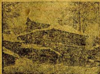
Дом 26, Коммунальная место мартовской конференции 1908 г. Явочная квартира.

Вырастают новые ткацкие корпуса—в Наволоках, на Томне, на Коноваловской фабриках. Выстроили новый ткацкий корпус фабриканты Константиновы. На Севрюговской строится новый корпус на 1.500 станков.