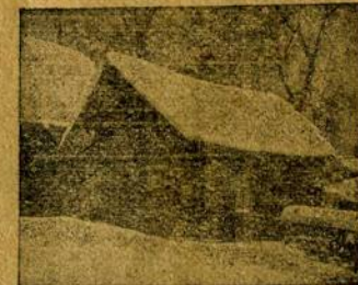
Явочная квартира Постнова

На его зов явилась полиция и начала ловить “бунтарей”. На площади полиции удалось захватить человек 20, которые и были посажены в полицию. Оставшиеся товарищи собрались на бульваре. Напротив полицейского управления и решили послать делегацию к исправнику Деморацкому с требованием о выпуске арестованных товарищей. Во главе делегации был А. В. Веселов. Требование было исполнено. Все арестованные товарищи были освобождены, но всех перед этим переписали. Все соединились вместе. Отсюда всей массой человек в 100 направились к фабрикам и заводам, по пути снимая рабочих с работы.