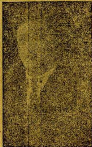
Чаев А. Я.

на свою сторону крепкого крестьянства. Издается закон о пре- выхода из общин, которым пользуются кулацкие элементы. Прави- тельство создает специальные землеустроительные комиссии и пе- редает в распоряжение Крестьянского банка часть госуд. и удель- ных земель для распределения богатым куестьянам. Эта новая аграрная политика царского правительства известна под названием «стольпинской». Параллельно с этим идет жестокое подавление рев. движения раб. класса.