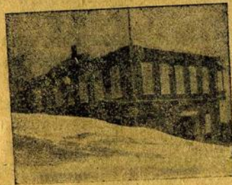
Городской театр. Место партработы