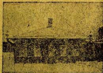
Дом угол Широкой и Овражной явочная квартира.

Состояние Кинешемской парторганизации в то время было тяжелое. После разгрома количество членов на фабриках резко упало. Так на Томне до ноябрьских событий было 68 чел., теперь осталось 50. На Ветке насчитывалось 63 члена, теперь осталось менее половины. Настроение рабочих масс было подавленное: нет защитников, все в тюрьмах. Фабриканты глумились: