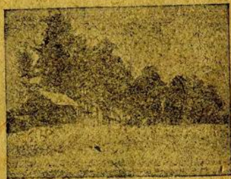
Жел. дор. будка. Место постов.

Партийный актив, обнаруженный при обыске, дал так же возможность установить, что известное влияние на кинешемскую организацию оказали общие партийные группировки того времени. Оформившееся на правом крыле партии ликвидаторское течение среди кинешемцев успеха не имело, но сторонники „левого течения“ находились. В то время в партии шел спор вокруг думской социал-демократической фракции. „Пролетарий“, центральный орган большевистской фракции, органы петербургского и московского комитетов, все время отстаивали необходимость существования фракции в стенах Думы с тем, чтобы эта фракция была использована в направлении, указанном в резолюции общероссийской конференции 1907 года и под руководством ЦК. Но часть бывших „бойкотистов“ не удовлетворялась такой постановкой вопроса. Они считали существование фракции в Думе вредным, так как фракция имея значительный состав меньшевиков, плохо подчинялась ЦК. Отзовисты отрицательно относились к использованию легальных возможностей партийной работы, требовали, чтобы партия целиком вернулась на свои дореволюционные позиции, не учитывая перемены обстановки не учитывая сделанного самодержавием шага к превращению в буржуазную монархию. Отзовисты не хотели понять, что сохранив-