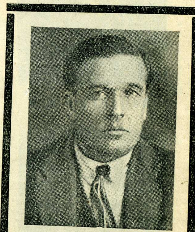
Г. К. КОРОЛЕВ. Умер 14 марта 1927 года.

И. П. Ленина Ив.-Вознесенского Райсоюзов К-вов в г. Кинешме. Тираж 5000 экз. Заказ № 301.