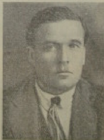
Г. К. КОРОЛЕВ. Умер 14 марта 1927 года.