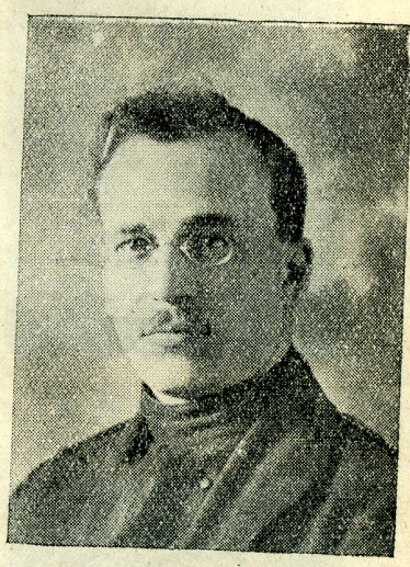
Н. Н. ЕВРЕИНОВ.