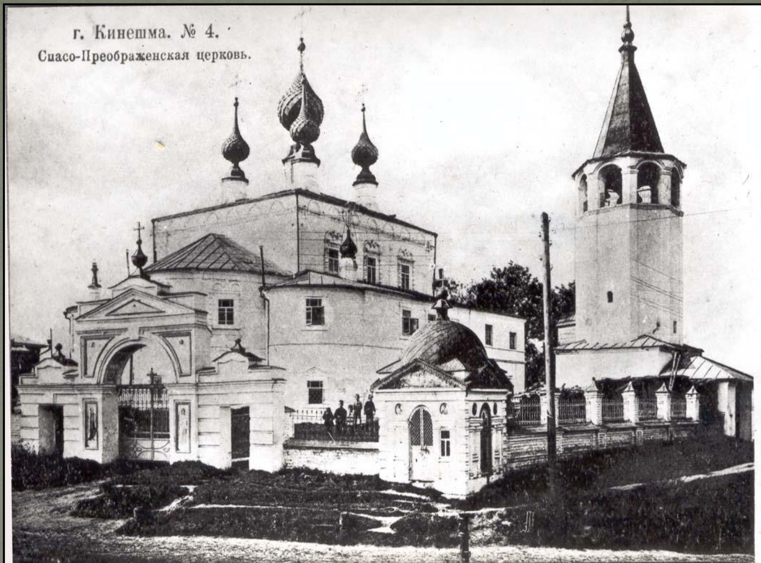
г. Кинешма. № 4. Спасо-Преображенская церковь.

Земли эти принадлежали Спасскому монастырю